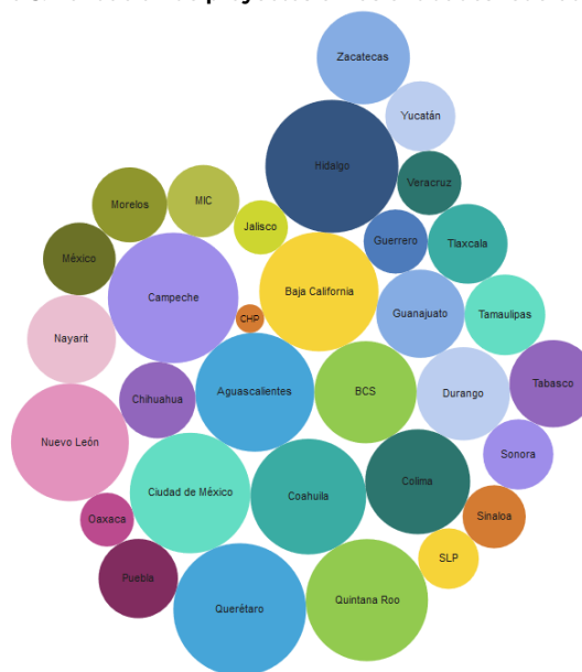
Figura 3: Validación de proyectos en las entidades federativas*

*Un área mayor significa un mayor esfuerzo de la entidad por validar los proyectos