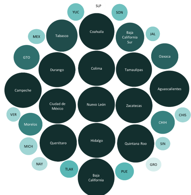
Figura 3: Validación de proyectos en las entidades federativas, tercer trimestre 2021*

*Un área mayor y un color más oscuro significa un mayor esfuerzo de la entidad por validar los proyectos