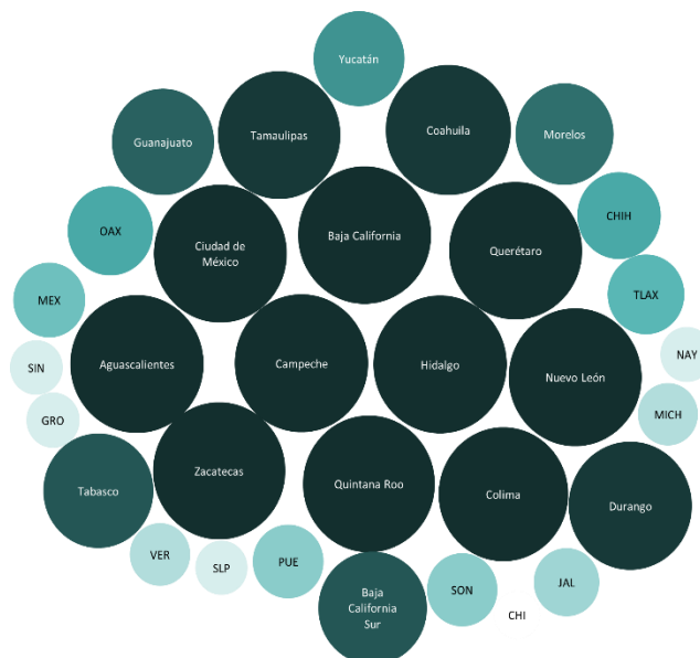
Figura 3: Validación de proyectos en las entidades federativas, primer trimestre 2021*

*Un área mayor significa un mayor esfuerzo de la entidad por validar los proyectos.